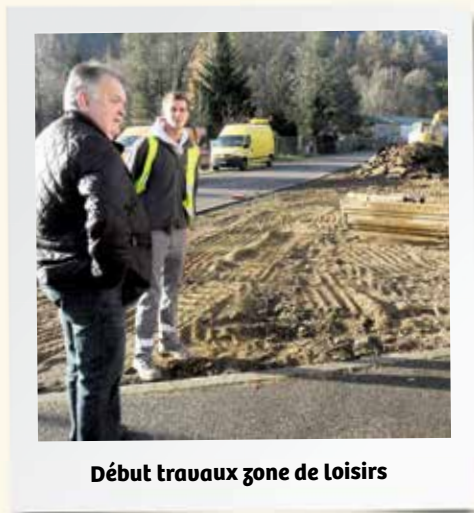
Début travaux zone de loisirs