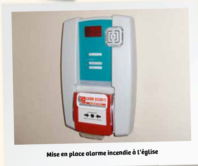
Mise en place alarme incendie à l'église