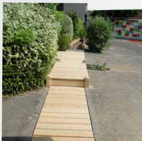
Remplacement passerelle école maternelle