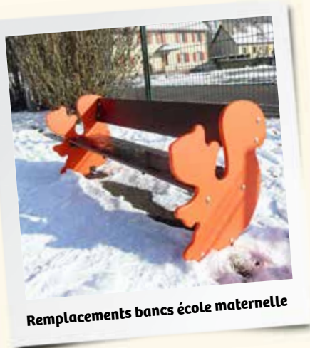
Remplacements bancs école maternelle