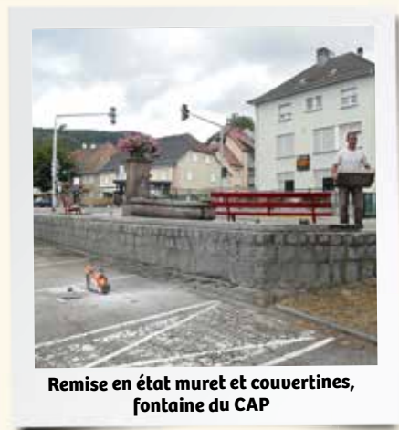
Remise en état muret et couvertines, fontaine du CAP