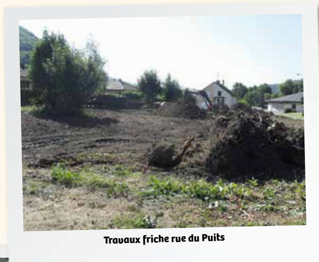
Travaux friche rue du Puits