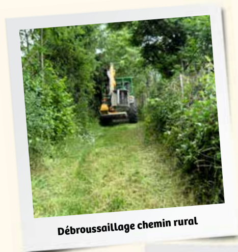
Débroussaillage chemin rural

De nombreux travaux ont été entrepris pour entretenir et embellir notre cité :