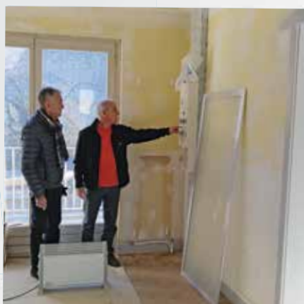
Réfection appartement trésorerie