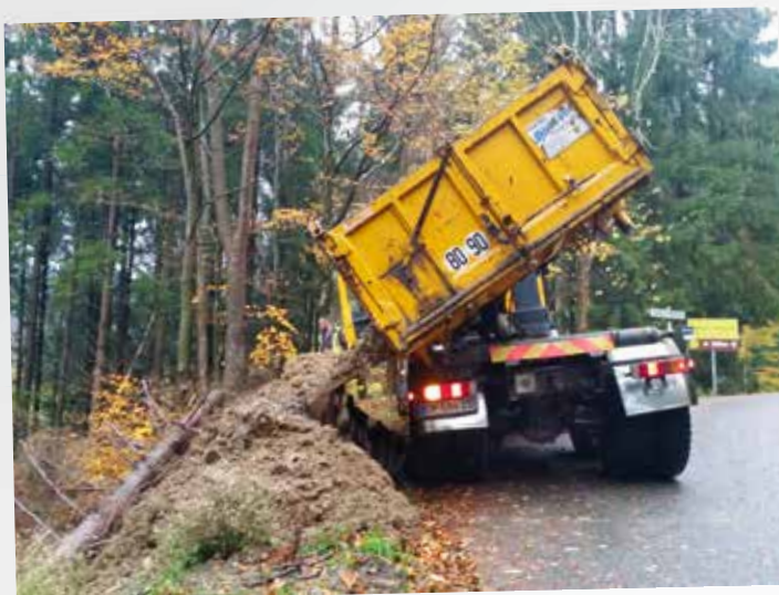
Merlon, virage du Mehrbachel