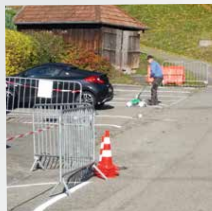
Marquage parking collège