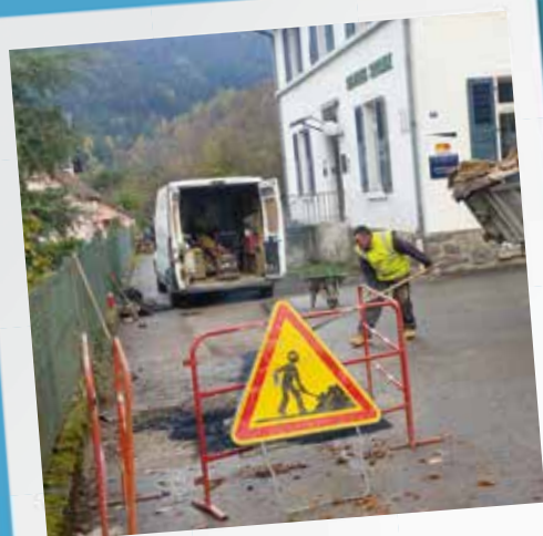
Assainissement services sociaux

Entretien et embellir notre cité est un objectif essentiel de la municipalité. Pour cela, de nombreux travaux sont entrepris pour garder à notre cité son attrait, améliorer le cadre de vie des citoyens et maintenir notre patrimoine commun :