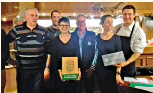
La succession est magnifiquement assurée dans la famille KORNACKER !

Du nouveau à Saint-Amarin : de nouveaux commerces pour répondre aux besoins des habitants et des distinctions pour une belle entreprise familiale.