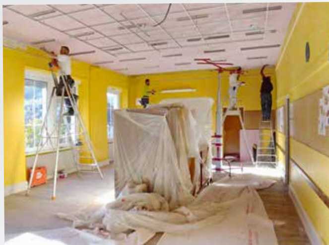
Salle de classe de l'école primaire en travaux