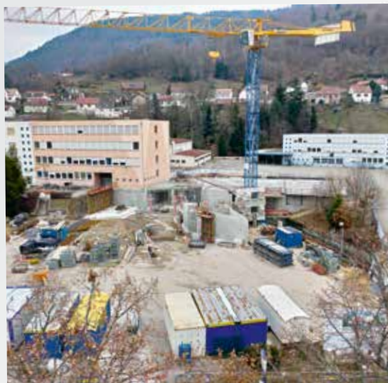
Collège Robert Schuman

Comme vous avez pu le voir, le collège Robert Schuman est dans une phase d'importante reconstruction. Cet important chantier piloté par le Conseil Départemental, débuté à l'été 2018, va se poursuivre sur plusieurs années. Les travaux vont bon train et respectent le planning initial.