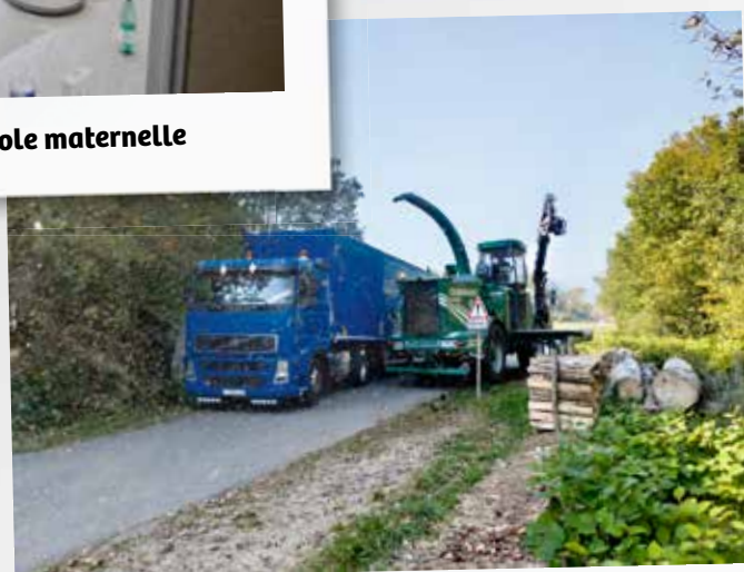
Travaux de broyage