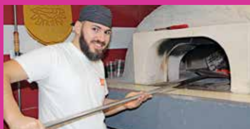
Une nouvelle adresse à découvrir !