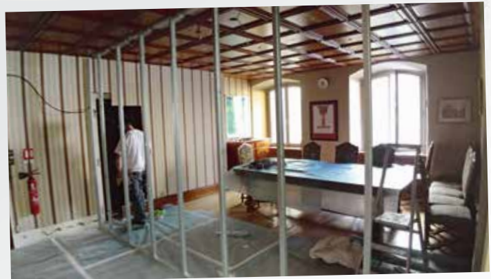
Réalisation du bureau d'accueil en mairie pour les papiers d'identité

La mairie «subit» également d'importants travaux d'accessibilité mais également une réorganisation des bureaux afin d'apporter un plus grand confort à nos administrés mais également à nos employés.