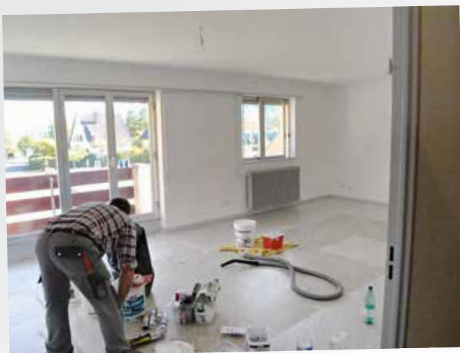
Rénovation appartement école maternelle

Parmi les autres travaux, nous pouvons citer :