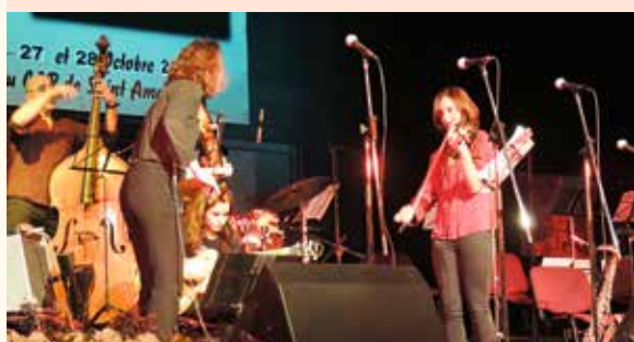
La 11 e édition se déroulera les 25, 26 et 27 octobre 2019.

Jazz New-Orléans, Blues, Rock, POP, Musique Classique, la diversité a ravi les quelques 2300 spectateurs qui ont assisté au festival « Jazz Amarinois », au concert des Tempo Kids et à celui des Elles Symphoniques. Plus de 150 musiciens et chanteurs ont investi la scène du CAP pour ces 3 événements.