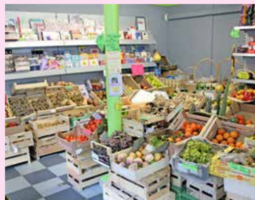
Le petit commerce au service des consommateurs !

Depuis quelques mois, L'épicier du village a pris ses quartiers en lieu et place de l'ancien tabac. Ouvert 7 jours sur 7, L'épicier du village propose des légumes et fruits frais, des produits laitiers, certaines conserves et boissons. L'épicier du village se veut au service des consommateurs pour répondre à leurs besoins quotidiens.