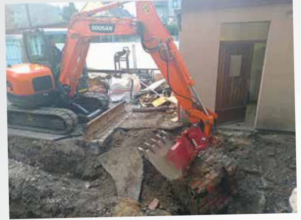
Travaux dans la cour de l'école

Ces travaux concernent l'accessibilité des locaux mais également des mises conformité «incendie» pour l'école primaire. Au terme de ces travaux, les élèves et enseignants disposeront d'une école renouvelée et agréable.