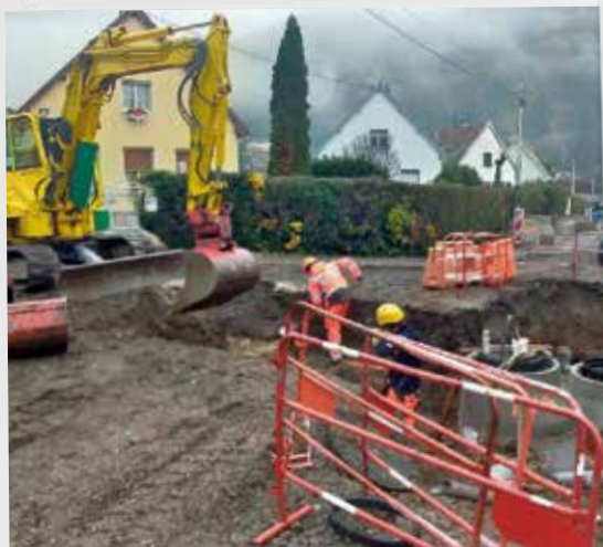
Travaux sur les réseaux eaux et assainissement, rue du Puits

Tout au long du semestre d'autres travaux ont été entrepris pour l'entretien et l'amélioration de notre cité :