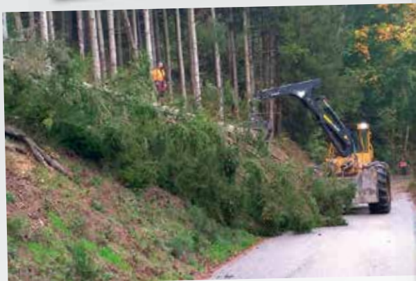
Sécurisation, route du Mehrbachel