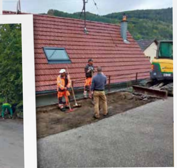
Travaux, placette Fistelhaeuser