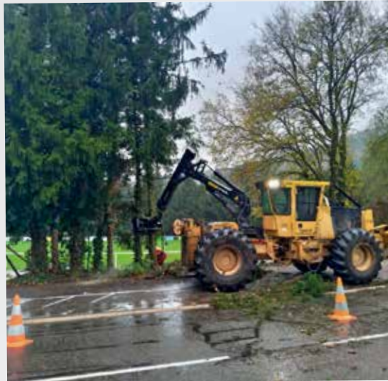
Ouverture du paysage au complexe sportif Fernand Gentner