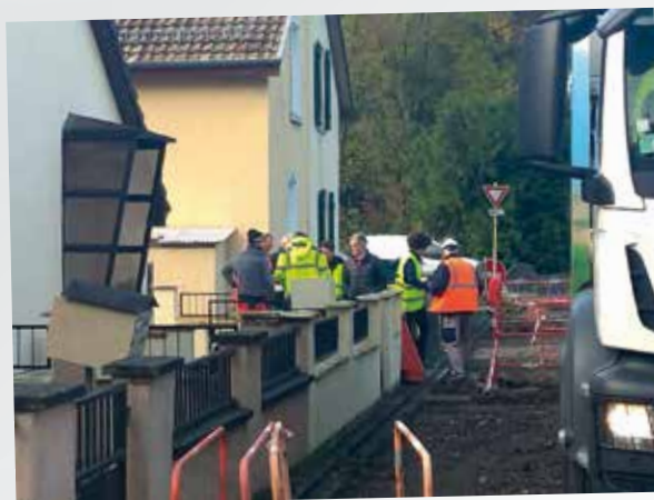
Travaux sur les réseaux eaux et assainissement, rue du Puits