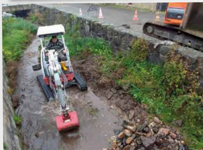
Curage du Vogelbach