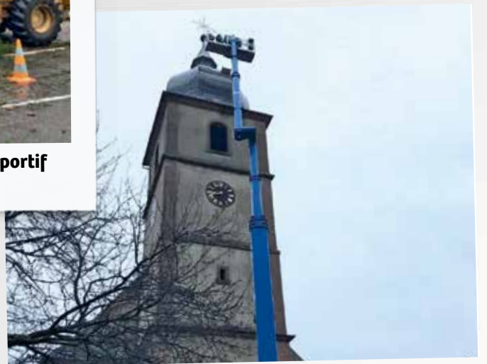
Réparation du clocher de l'église suite à un sinistre