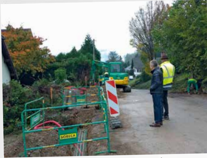
Enfouissement des réseaux secs et installation nouveaux luminaires LED (économie d'énergie), voirie Voglebach