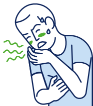
Vertiges / Nausées