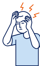
Maux de tête